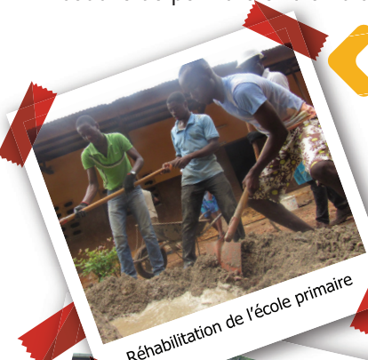
Réhabilitation de l'école primaire