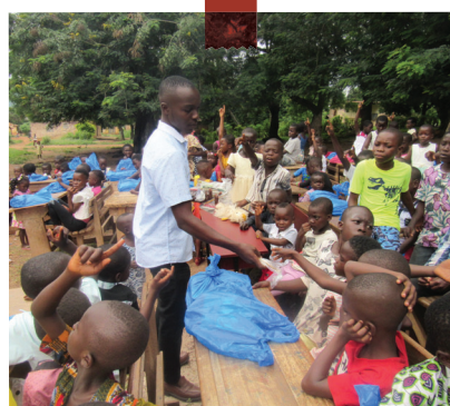
Dons de kits scolaires