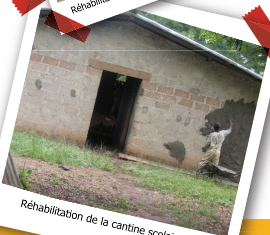
Réhabilitation de la cantine scolaire